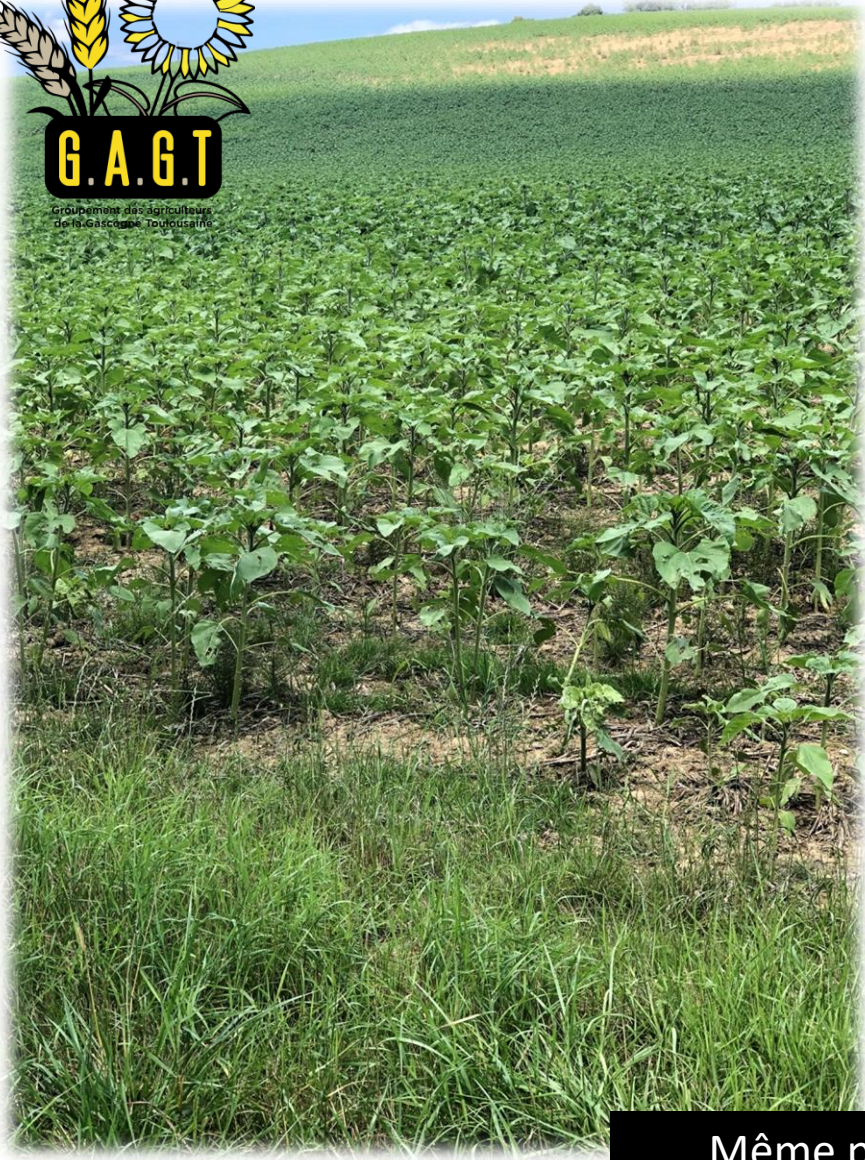
AVEC COUVERTS DE FEVES Semis mi-avril