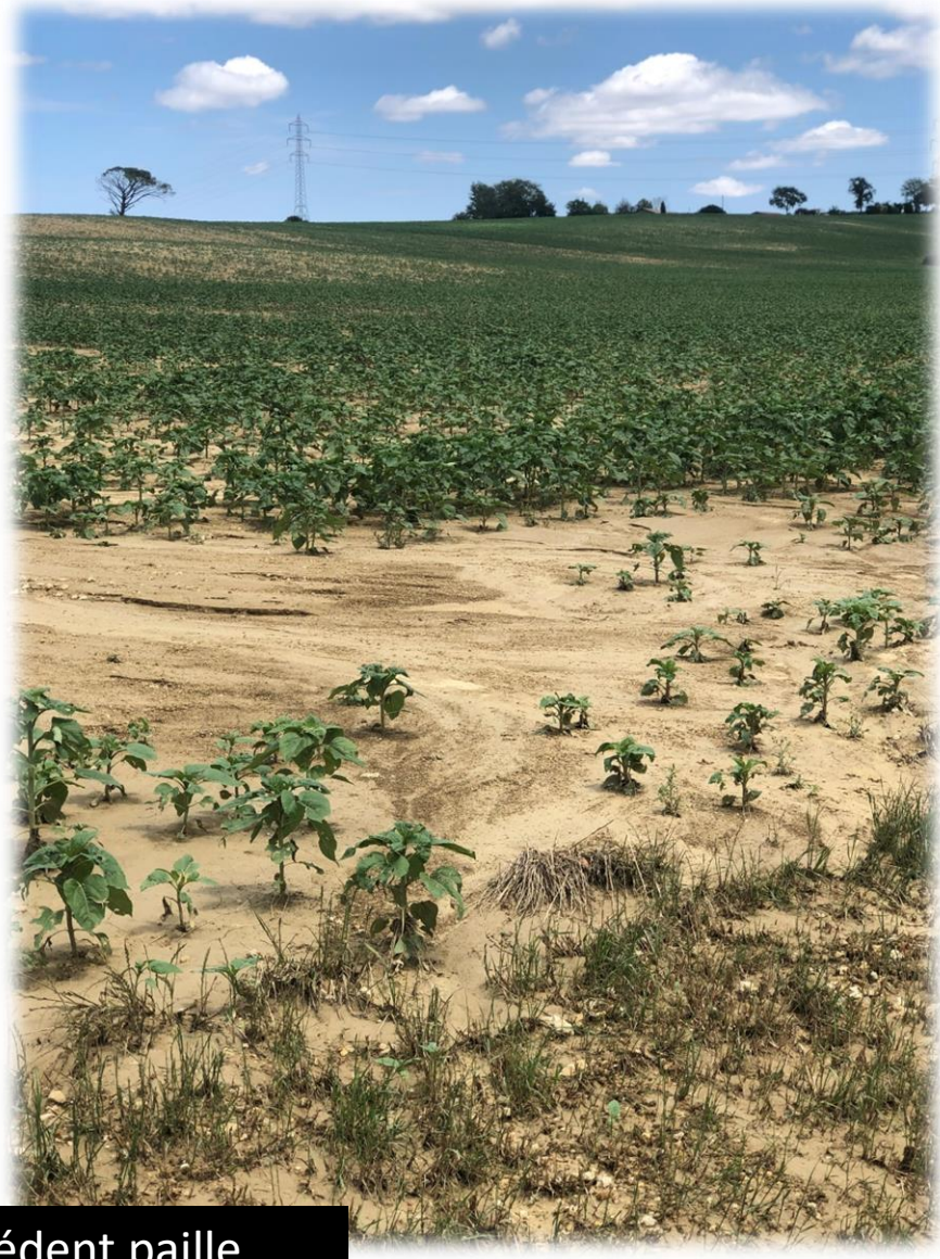
SANS COUVERTS DE FEVES Semis début mai